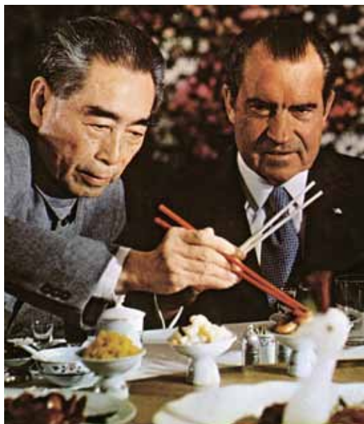
Trots sitt tillkortakommande med Watergateaffären kan Richard Nixon ses som en av 1900-talets stora maktpolitiker. Hans närmande till Kina banade vägen för en avspänning, men också en väg ut ur Vietnamkriget.

Redan i slutet av 1971 visste amerikanerna att Nordvietnam förberedde en storoffensiv. På Nixons order började också flygstridskrafterna i Sydostasien att förstärkas. När påskoffensiven väl rullat igång trappades dessa förflyttningar upp. Fram till den 13 maj fördubblades antalet F-4 stridsflygplan i regionen till 374. Antalet B-52 bombplan ökade från 84 till 210, vilket betydde att mer än hälften av Strategiska flygkommandot SAC:s (Strategic Air Command) B-52:or blivit mobiliserade för kriget i Vietnam. Femtiotvå av planen fanns på den thailändska flygbasen U Tapao och resten på Andersen-basen på ön Guam i Stilla